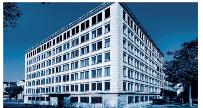
Le siège du groupe Mirabaud, où toutes les mesures ont été prises afin de réduire l'empreinte écologique.