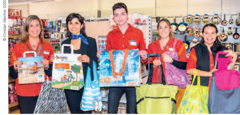
Migros Genève propose de nombreux sacs réutilisables pour faire ses courses en préservant l'environnement.