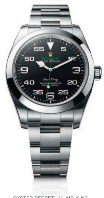
OYSTER PERPETUAL AIR-KING

Inspirée par l'âge d'or de l'aviation dans les années 1930, l'Air-King est un hommage à l'héritage aéronautique de la Rolex Oyster. Créée dans l'unique esprit Rolex pour une résistance et une fonctionnalité exceptionnelles, elle affiche une échelle des minutes au premier plan et de grands repères à 3, 6 et 9 heures conçus pour une lisibilité optimale des temps de navigation. Son boîtier Oyster de 40 mm doté d'un écran anti-magnétique préserve sa précision superlative, tandis que l'inscription « Air-King » sur son cadran rappelle le modèle original des années 1950. Bien plus qu'une montre, un témoin de son temps.