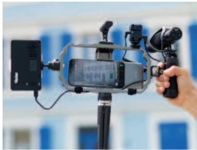
Comment créer vos vidéos d'entreprise avec un smartphone !

Donner un nouvel élan à la communication digitale d'une entreprise avec un budget adapté, c'est la toute récente mission de BeVisible ! Sa nouvelle formule de formation apporte la solution qui permet à des collaborateurs de réaliser des vidéos de qualité avec un smartphone.