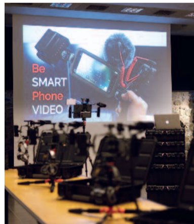
La formation BeSMARTphoneVIDEO pour vos collaborateurs au Château de Prangins.

Grâce à ce projet BeSMARTphoneVIDEO pour collaborateurs, les entreprises vont pouvoir effectuer des rushes vidéo tout au long de l'année. Comment les utiliseront-ils ? En créant des capsules vidéo pour les réseaux sociaux ou en les conservant dans une banque de données qui seront exploitables pour réaliser une vidéo storytelling