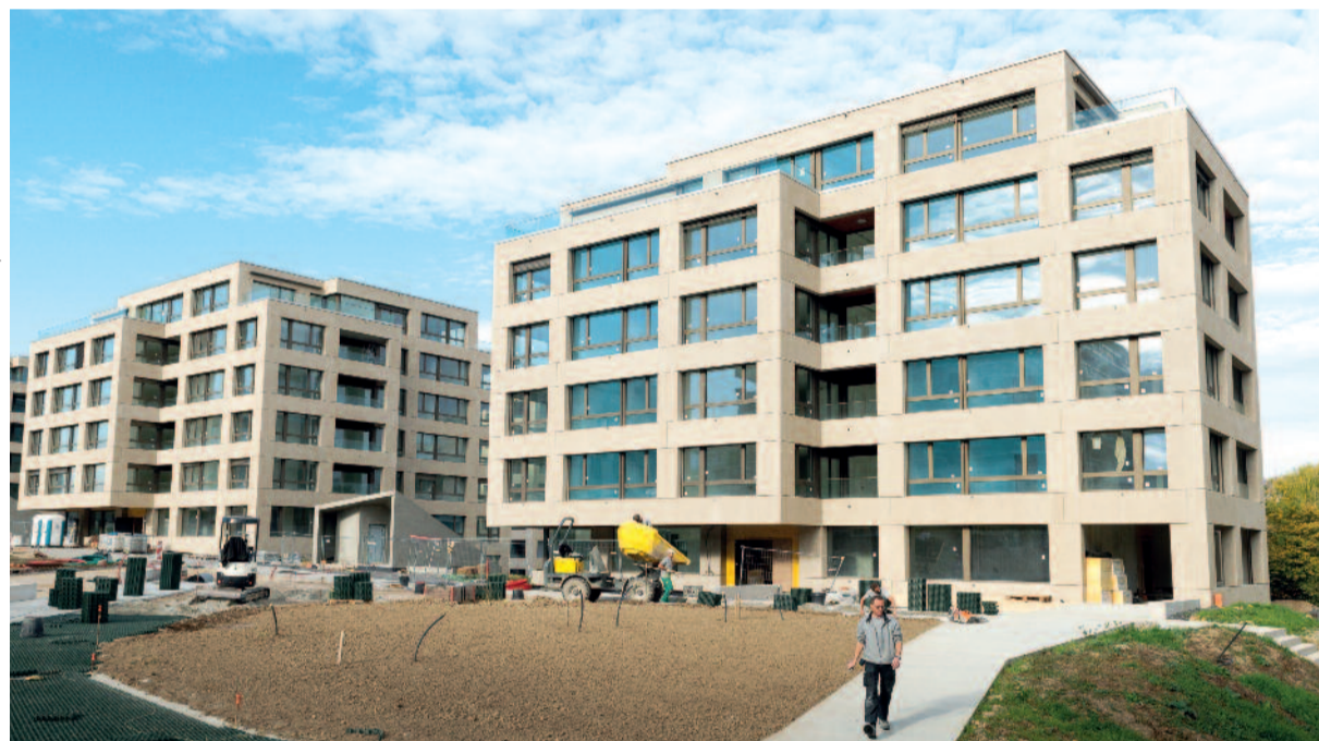
Chantier de la Chapelle

La solution à la pénurie d'appartements à Genève passe essentiellement par la construction de nouveaux logements, quelle que soit leur typologie. Le canton a pris trop de retard avec une production anémique pendant des années pour continuer à se focaliser sur des acronymes plutôt que sur la construction. Ce n'est qu'après un inventaire précis et concret de l'habitat social existant que l'on pourra évaluer les manques éventuels dans ce domaine.