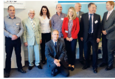
La désormais traditionnelle photo des orateurs du Midi.

Un partenaire solide : avec plus d'un million de clients privés et entreprises, Allianz Suisse compte parmi les compagnies d'assurances majeures de Suisse. Allianz Suisse est un partenaire fiable pour les petites et moyennes entreprises en matière de prévoyance professionnelle ou de protection du personnel et de l'exploitation. Dans le secteur de la prévoyance professionnelle, les clients peuvent en outre se fier à sa solidité financière. www.allianz.ch