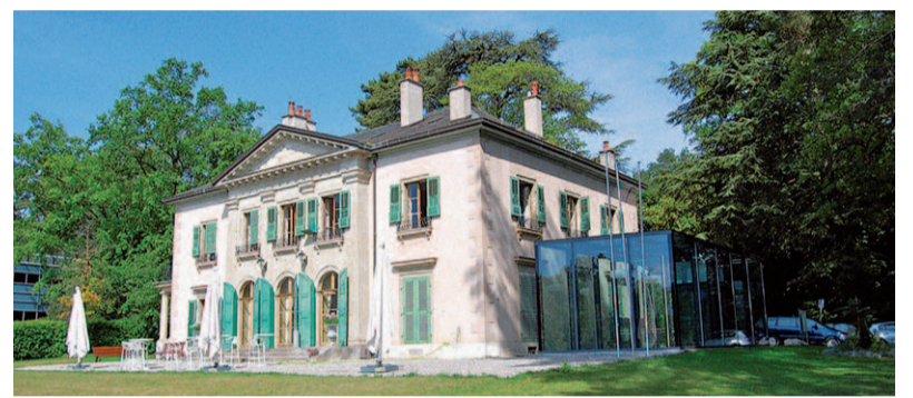
Le CAGI accueille les internationaux dans la Villa La Pastorale, près de la place des Nations.

Des kits de bienvenue, conçus à l'origine par la CCIG, sont remis régulièrement aux responsables RH des multinationales, qui les distribuent à leurs nouveaux collaborateurs expatriés. La consultation de son site internet ( www.cagi.ch ), très complet et mis à jour quotidiennement, est vivement